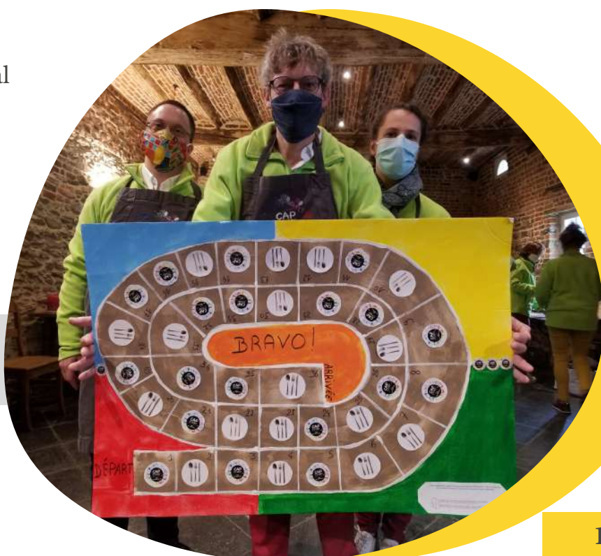
| Jeu de l'oie géant